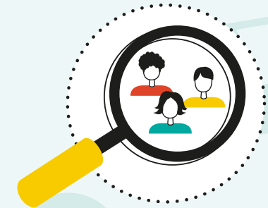
Vinden en bereiken NT1 en NT2