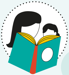
Gezin en basisvaardigheden

Het Expertisepunt Basisvaardigheden is er voor iedereen die volwassenen met beperkte basisvaardigheden helpt bij het verbeteren van die basisvaardigheden. Het is dé plek waar je kennis kunt vinden en delen. En waar je inspiratie en samenwerking vindt.